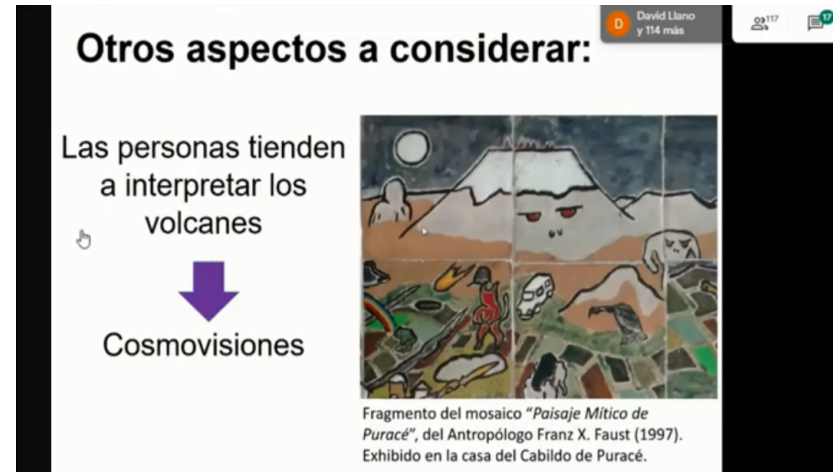
Imagen 1: Conferencia virtual: Las representaciones gráficas de volcanes: ¿qué nos dicen acerca de la percepción de las amenazas volcánicas?